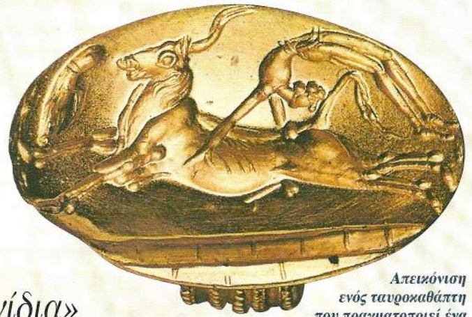
Απεικόνιση ενός ταυροκαθάψτη που πραγματοποιεί ένα επικίνδυνο κυβίστημα πάνω από έναν ταύρο που καλπάζει. Χρυσό δακτυλίδι. Οξφόρδη, Ashmolean Museum.

«Από την Ερωτοτροπία της Παισιφάης στα Μινωικά Παιχνίδια»