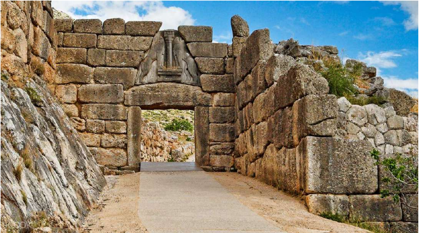
Μυκήνες. Πύλη των Λεόντων.

από αυτές τις ροές της λάβας, επιστημονικά δημιουργημένες, με το μάτι υγρό. Ο Έλληνας που ζει, αυτός τριγυρίζει απαρατήρητος ανάμεσα σ' όλα αυτά, όταν δεν τον θεωρούν σαν ένα παρείσιακτο. Όμως η καινούργια Αθήνα σκεπάζει σχεδόν όλη την κοιλάδα, σκαρφαλώνει έρποντας στα πλευρά των ολόγυρα λόφων.