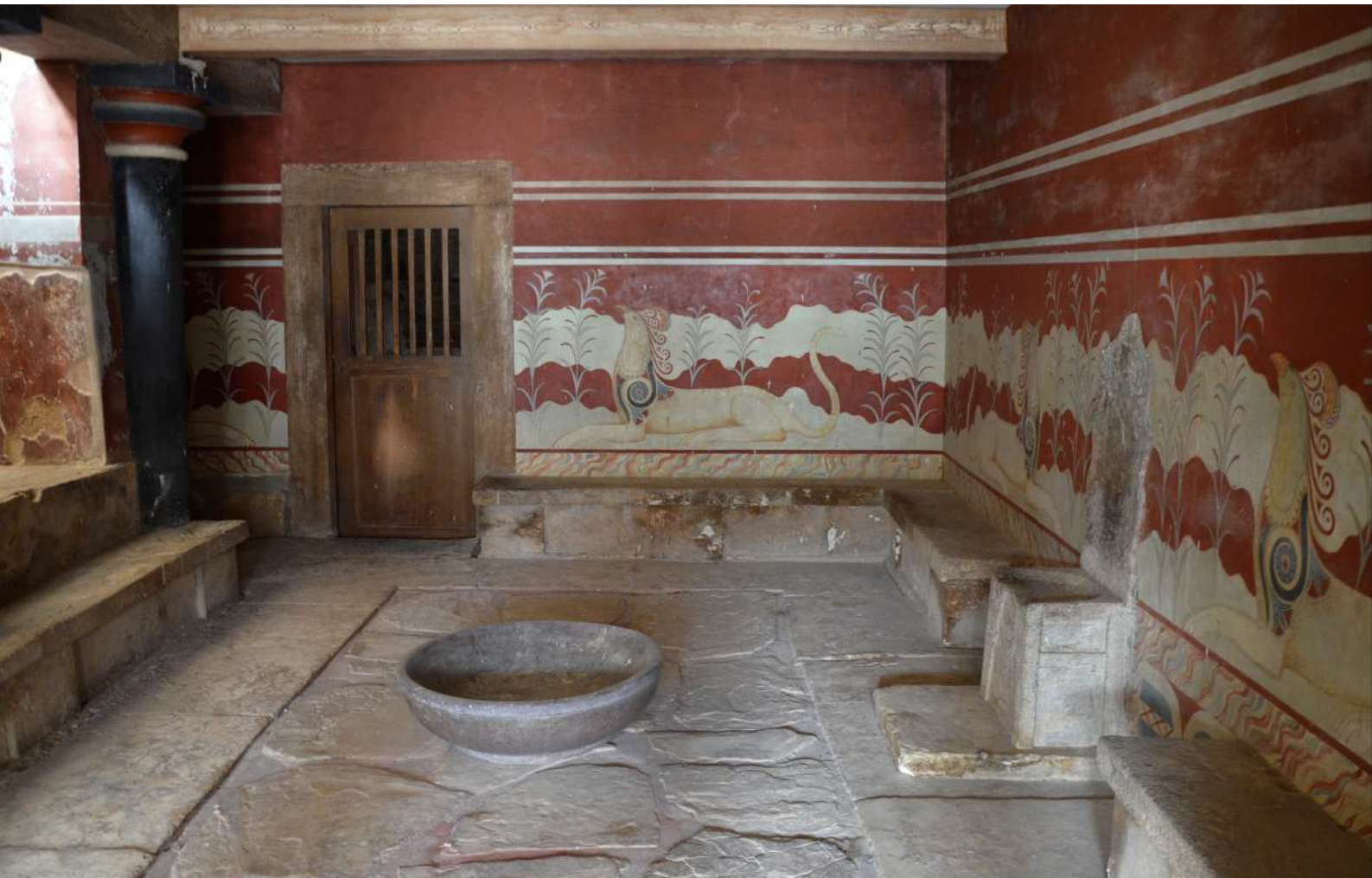
Κνωσός, Αίθουσα του θρόνου.