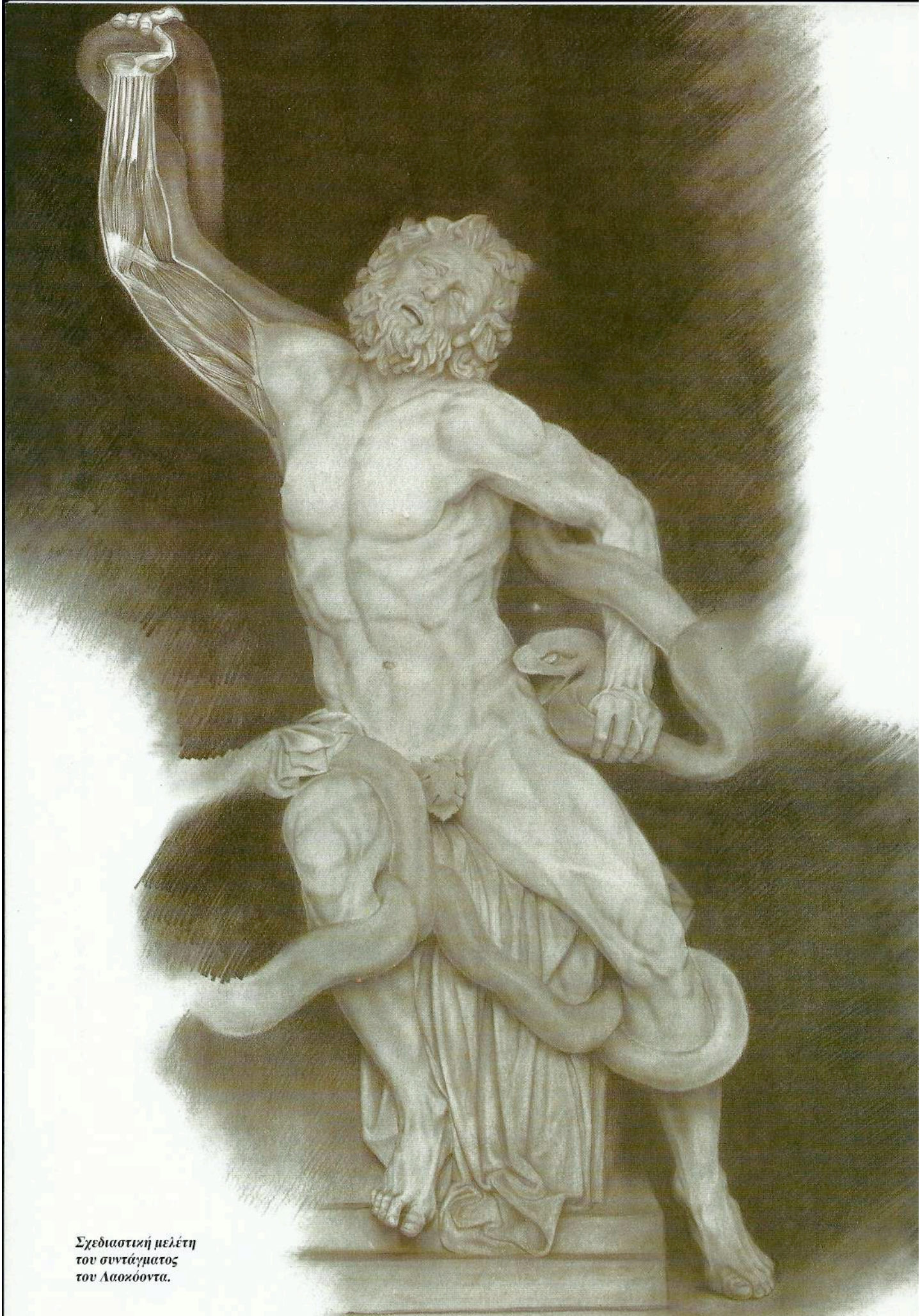
Σχεδιαστική μελέτη του συντάγματος του Λαοζόοντα.