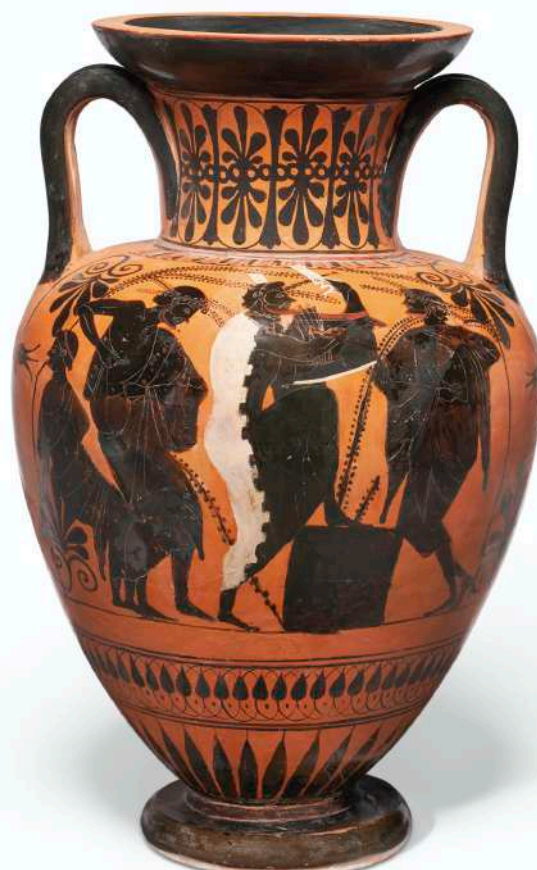
5. Αττικός μελανόμορφος αμφορέας με λαιμό, του Ζωγράφου Λυσιππίδη, ύστερος μελανόμορφος ρυθμός, 530-520 π.Χ., Ύψος 42,2 εκ., (β' όψη).