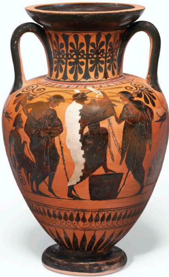
7. Αττικός μελανόμορφος αμφορέας με λαιμό, του Ζωγράφου του Αχελώου, 520-510 π.Χ., Ύψος 44,4 εκ. (β' όψη).