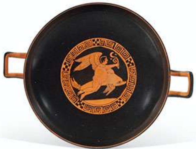
8-10. Αττική ερυθρόμορφη κύλικα του Ζωγράφου της Ιένας, αρχές 4ου αι. π.Χ., Διάμετρος: 23,7 εκ. (χωρίς τις λαβές).

© Christie's / Δημοπρασία - Απρίλιος 2021