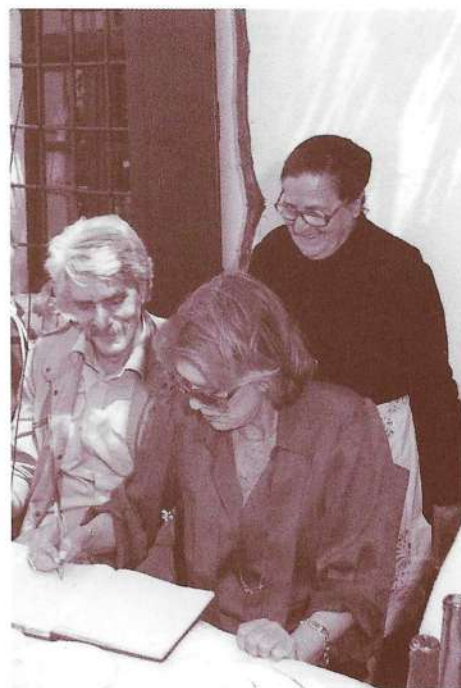
1984. Η Μελίνα Μερκούρη υπογράφει το βιβλίο επισκεπτών του σπιτιού των Αρχανών.

Μέσα σε τούτες τις βουβές κατολισθήσεις της ψυχής προς την άβυσσο της προϊστορίας, στις μεταμορφώσεις του φωτός και της σκόνης των άστρων, η γερασμένη σάρκα στέκεται ακλόνητη στο πεζούλι του μιτάτου