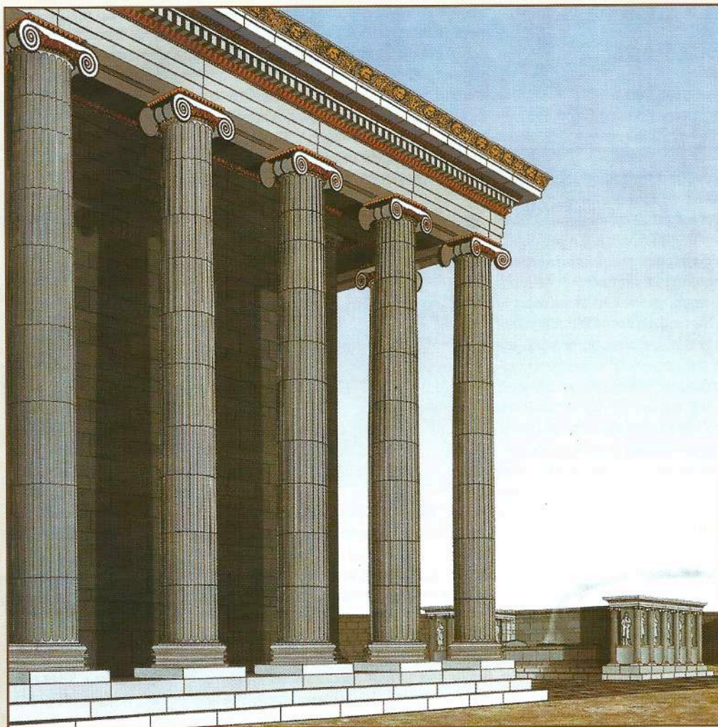
Αποψη του δυτικού πέρατος της Ιεράς Στοάς (σχέδιο κατά τον Krischen/ Πριήνη, ΙΜΕ, σελ. 66).

που τους στεφανώνει, και μαζί και του βωμού. Η περιήγηση βέβαια δεν τελειώνει εδώ: το Ασκληπιείο (ή Ιερό του Διός), το Ιερό της Δήμητρας και της Κόρης (με προοπτικό του ναού) και άλλα ιερά και δημόσια οικοδομήματα, όπως το σπουδαίο Θέατρο της πόλης (με όψεις και προοπτικά της σκηνής και του προσκήνιου), το Γυμνάσιο με το γειτονικό Στάδιο, αλλά και οι ανιές και τα προστώα των απλών σπιτιών, παρουσιάζονται στον αναγνώστη μέσα από τις σελίδες του βιβλίου, ζωντανεύοντας κάθε γωνιά της Πριήνης. Τα αρχιτεκτονικά σχέδια της έκδοσης έγιναν με Autocad 14 και με Corel 7. Η γραφιστική επεξεργασία έγινε με το πρόγραμμα Photoshop 4. Το τρισδιάστατο πρόπλασμα σχεδιάστηκε με το πρόγραμμα ArcView (3D-Analyst).