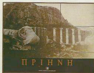
Το εξώφυλλο του βιβλίου «Πριήνη», ΙΜΕ, 2000.

ες αποκαλύπτεται η ζωή σε μια αρχαία ελληνική πόλη. Η Πριήνη ιδρύθηκε το 334 π.Χ., όταν η παλαιότερη πόλη - της οποίας μέχρι τώρα αγνοείται η θέση - μεταφέρθηκε στη νέα θέση. Η πλειονότητα των ερειπίων της προέρχεται από την (ύστερη) κλασική και ελληνιστική περίοδο και παρουσιάζει