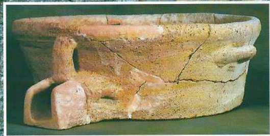
Πήλινος ληνός για τη σύνθλιψη σταφυλιών. Δωμάτιο 2 του Κτηρίου 4 στο Φουρνί Αρχαίων (Γ. & Ε. Σακελλαράκη, Κρήτη Αρχάνες, Εκδ. Αθηνών 1991, σελ. 89, εικ. 64).