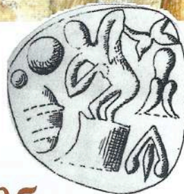
Σκηνή σύνθλιψης σταφυλιών. Παλαιοανακτορική σφραγίδα από το νεκροταφείο στον Χρυσόλακκο Μαλίων (Κατερίνα Κόπακα, Αρχαία Αιγαιακά Πατητήρια, Πρακτικά 1ου Διεθνούς Συνεδρίου - Θεσ/νίκη 1997, σελ. 241, εικ. 3).

Ο ι πήλινοι ληνοί (κολουροκωνικοί κάδοι με κρουνό) σύνθλιψης σταφυλιών θεωρούνται μινωικό τεχνολογικό επίτευγμα, το οποίο περιορίστηκε στα γεωπολιτιστικά όρια της Κρήτης, δεδομένου ότι, σύμφωνα με τα έως τώρα ανασκαφικά ευρήματα, δεν υιοθετήθηκαν από τους Μυκηναίους Έλληνες. Πλήθος ανασκαφικών δεδομένων μαρτυρά τη χρήση πήλινων ληνών στη μινωική Κρήτη ήδη από την 3η χιλιετία π.Χ. (πρωτομινωικό Πβ [2200 π.Χ.] πιεστήριο από τον Μύρτο Ιεράπετρας) έως και το τέλος της 2ης χιλιετίας π.Χ., οπότε εμφανίζονται και λίθινα πιεστήρια (υστερομινωικό ΠΙ [1400-1100 π.Χ.] πιεστήριο από τον Κομμό). Οι πήλινοι ληνοί ήταν εγκατεστημένοι σε ειδικά διαμορφωμένες οικοδομημένες εγκαταστάσεις είτε κοντά στα ανακτορικά κέντρα (εγκαταστάσεις ληνού στη ΒΑ Οικία της Ζάκρου και στο Κτήριο 4 από το νεκροταφείο στο Φουρνί Αρχαίων) είτε σε αγροικίες (Βαθύπετρο και αγροικία Επάνω Ζάκρου). Τα παραδείγματα αυτά καταδεικνύουν πως για τη λειτουργία ενός σταφυλοπιεστηρίου οι Μινωίτες χρησιμοποιούσαν ειδικά διαμορφωμένους, απλούς ή σύνθετους, χώρους σύνθλιψης και συλλογής του μούστου. Στο πατητήρι των Αρχαίων το δάπεδο λαξεύθηκε με τέτοιο τρόπο, ώστε να σχηματιστεί μια ελλειπτικού σχήματος δεξαμενή συλλογής, ενώ σε άλλα παραδείγματα (Βαθύπετρο, ΒΑ οικία Ζάκρου και αγροικία Επάνω Ζάκρου)