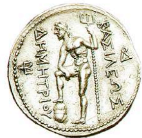
Αργυρό (AR) τετράδραχμο Δημητρίου Πολιορκητού, π. 294-288 π.Χ. Βάρος 17,16 γρ. Νομισματοκοπείο Αμφίπολης. [Newell 124] (CNG)

Εμπροσθότυπος: Κεφαλή θεοποιημένου Δημητρίου Πολιορκητού προς τα δεξιά με διάδημα και κέρατα ταύρου. Κύκλος σφαιριδίων. Οπισθότυπος: ΒΑΣΙΛΕΩΣ ΔΗΜΗΤΡΙΟΥ. Ποσειδών γυμνός, στέζεται προς τα αριστερά, πατώντας σε βράχο με το δεξί πόδι και κρατώντας τρίαινα με το αριστερό χέρι. Μονογράμματα αριστερά και δεξιά στο πεδίο. Κύκλος σφαιριδίων.