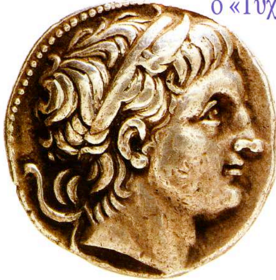
Αργυρό (AR) τετράδραχμο Δημητρίου Πολιορκητού, π. 289-288 π.Χ. Κεφαλή θεοποιημένου Δημητρίου Πολιορκητού προς τα δεξιά με διάδημα και κέρατα ταύρου. Νομισματοκοπείο Αμφιπόλεως (Νομισματικό Μουσείο Αθή- νας, 1616α).

«Ὅσπερ οὐ βασιλεὺς, ἀλλ' ὑποκριτὴς, μετα- φιέννεται γλαυῦδα φαιάν ἀντί τῆς τραγικῆς ἐκεί- νης, καὶ διαλαθὸν ὑπεχώρησεν.»