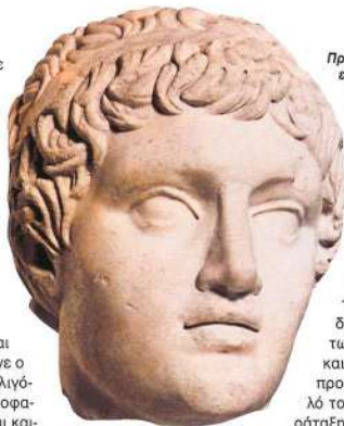
Προτομή του Λυσίμαχου. Ρωμαϊκό αντίγραφο ελληνιστικού έργου (Αρχαιολογικό Μουσείο Κωνσταντινούπολης).

Ο Δημήτριος είχε στη μάχη της Γάζας 11.000 βαριά οπλισμένους πεζούς και 4.400 ιππείς, αλλά διέθετε ακόμη 43 πολεμικούς ελέφαντες, γεγονός που του έδινε ένα ενονο συναίσθημα υπεροχής. Από την άλλη, ο Πτολεμαίος δεν είχε ελέφαντες, αλλά υπερτερούσε αριθμητικά του αντιπάλου του. Διέθετε 22.000 στρατό, αποτελούμενο από Μακεδόνες και μισθοφόρους, εκ των οποίων οι 18.000 ήταν βαριά οπλισμένοι πεζοί και οι 4.000 ιππείς. Επίσης, είχε πλήθος Αιγυπτίων ψιλών και άλλων βοθητικών, καθώς και κα-