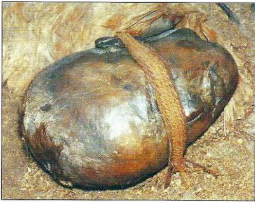
Το κορίτσι του Windby, το οποίο βρέθηκε στη Βόρεια Γερμανία το 1950, πέθανε από άγνωστους λόγους. Ενας επίδεσμος κάλυπτε τα μάτια του τη στιγμή που το τοποθέτησαν στο βάλτο. Όπως στο κορίτσι του Yde, έτσι κι εδώ τα μαλλιά είχαν ξυριστεί στο μισό τμήμα της κεφαλής.