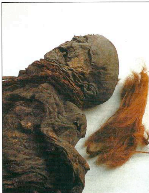
Ένα δεκαεξάχρονο κορίτσι, του οποίου το σώμα βρέθηκε στο Yde της Ολλανδίας το 1897, έφερε εμφανώς ίχνη στραγγαλισμού. Η αρχική όψη της αναπλάστηκε από ειδικό επιστήμονα του Παν/μίου του Manchester (Το σώμα: Silkeborg Museum. Η αναπαράσταση: P.Bosma).

Οι σκαπανείς της Β.Ευρώπης έπαιρναν τύρφη για να χρησιμοποιηθεί ως καύσιμο υλικό εδώ και εκατοντάδες χρόνια, με αποτέλεσμα οι εκτάσεις τύρφης να υποχωρούν σταδιακά, αποκαλύπτοντας έτσι πολλά ανθρώπινα πτώματα. Τα σώματα αυτά βρέθηκαν ελαφρά συρρινωμένα και μερικές φορές αποσπασματικά, έχοντας απορροφήσει το χρώμα και την υφή της όξινης τύρφης. Σε μερικές περιπτώσεις τα οστά τους είχαν αποσβεστωθεί, ενώ μόνο το δέρμα και τα εσωτερικά όργανα είχαν διατηρηθεί ικανοποιητικά. Ο αριθμός των ταφών σε βάλτους, που έχουν εντοπιστεί στη Βόρεια Ευρώπη είναι πραγματικά αξιοσημείωτος. Στη Δανία έχουν βρεθεί 166, στη Γερμανία 215, στην Ολλανδία 48, στη Βρετανία και στην Ιρλανδία 120 ταφές. Οι περισσότεροι μελετητές συμφωνούν τώρα ότι τα πτώματα των βάλτων δεν αποτελούν υπολείμματα ανθρώπων, οι οποίοι αφού έχασαν τον δρόμο τους για το σπίτι, έπεσαν από ατύχημα μέσα σε λιμνάζοντα ύδατα. Υπάρχουν πολλές μαρτυρίες για τη συμμετοχή σε αυτή την πράξη κι άλλων ανθρώπων, γεγονός το οποίο υποδηλώνει έμμεσα ανθρωποκτονία. Αλλά αν τους δολοφόνησαν, ποιος το έπραξε και για ποιο λόγο; Θυσίες για την εξασφάλιση καλής σοδειάς, για τον εορτασμό στρατιωτικών επιτυχιών για την ανάρρωση από αρρώστιες ή ως τιμωρία για διάπραξη εγκληματικών πράξεων ή ακόμη για θεωρούμενες κοινωνικές ατέλειες (ανωμαλίες), όπως η ομοφυλοφιλία (όπως πίστευε ο Heinrich Himmler) έχουν όλα προταθεί. Ο Ρωμαίος ιστορικός Τάκιτος αναφέρει πως οι βάρβαρες γερμανικές φυλές τους λι-