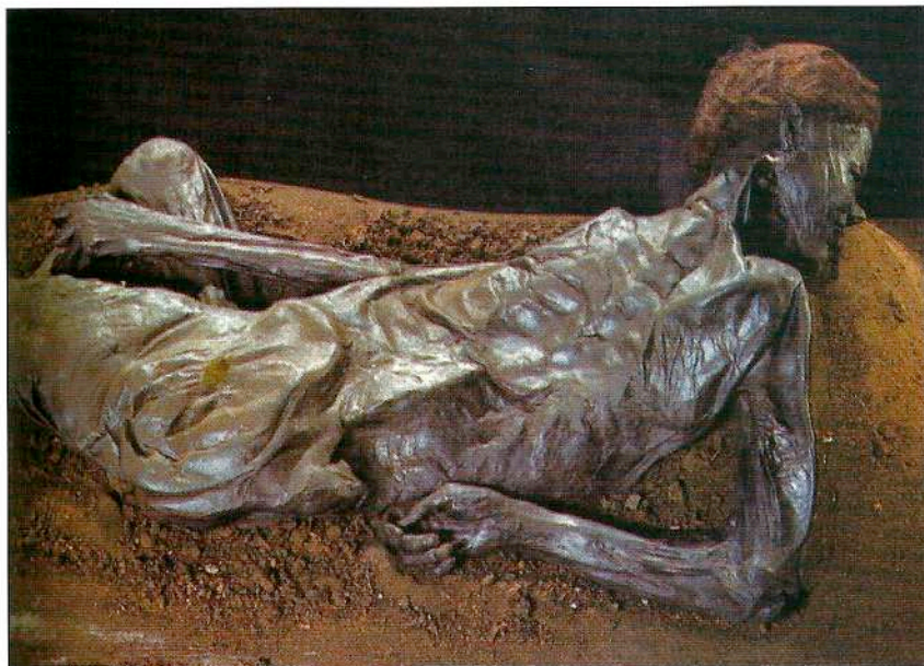
Ο βαθιά κομμένος λάρνγγας του άνδρα του Grauball, ο οποίος βρέθηκε το 1952 σ' έναν άλλο βάλτο της Δανίας, ίσως αποτελεί τεκμήριο τέλεισης κάποιας ανθρωποθυσίας. Ραδιοχρονολόγηση και ανάλυση της γύρης τοποθέτησαν χρονικά το συμβάν περίπου 20 αιώνες πριν, πείθοντας τελικά τις αρχές της Δανίας ότι το πτώμα δεν ανήκε σε ένα πρόσφατο θύμα δολοφονίας (Moesgaard Prehistoric Museum, Aarhus, Denmark).

σκούφο μέχρι και το τελευταίο γεύμα του άνδρα του Tollund. Το δέρμα ήταν ανέπαφο στο μεγαλύτερο τμήμα του κορμού, ενώ το καλύτερα διατηρημένο κεφάλι έφερε ακόμη τα κουρεμένα του μαλλιά, καθώς και γένια λίγων ημερών. Τη στιγμή του θανάτου ήταν περίπου 30 ετών. Ανάλυση του περιεχομένου του στομαχιού και των εντέρων αποκάλυψε τα συστατικά του τελευταίου γεύματος: χυλός από κριθάρι, λινόσποροι, αγριοβότανα και χαμομήλι, είδος τροφής, το οποίο προσφερόταν συνήθως σε κάποιον κρατούμενο καταδικασμένο σε θάνατο. Το 1954 δύο Βρετανοί αρχαιολόγοι δοκίμασαν μια σύγχρονη εκδοχή του χυλού, κρίνοντας τον ελάχιστο νόστιμο, ακόμη κι όταν τον συνόδευαν με καλό δανέζικο μπράντυ. Την εποχή που ανακαλύφθηκε ο άνδρας του Tollund, οι διαθέσιμες τεχνικές προσέφεραν τη δυνατότητα δια-