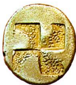
Αργυρή (AR) δραχμή Θάσου, 463-411 π.Χ.