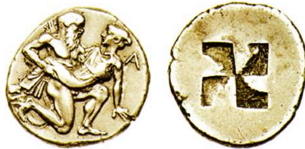
Αργυρός (AR) στατήρας Θάσου, 411-390 π.Χ. Βάρος 8,730 γρ. [Gr. 3] (ANS/1941.153.358) Εμπροσθότυπος: Αρπαγή Νύμφης από Σίληνό. Η Νύμφη δεν προβάλλει αντίσταση και έχει το δεξί της χέρι με τα δάκτυλα χαλαρωμένα πίσω από το κεφάλι του Σίληνού. Ο ιθυγαλλικός Σίληνός τρέχει προς τα δεξιά. Α άνω δεξιά. Οπισθότυπος: Εγκοίλο τετράγωνο.

70). Στην περίπτωση της Θάσου η προσωπική μαρτυρία του Αρχίλοχου, που ως μισθοφόρος βρέθηκε στο νησί, είναι πολύτιμη για να ανασυνθέσουμε μαζί με τα αρχαιολογικά δεδομένα την αιώτατη ιστορία του νησιού.