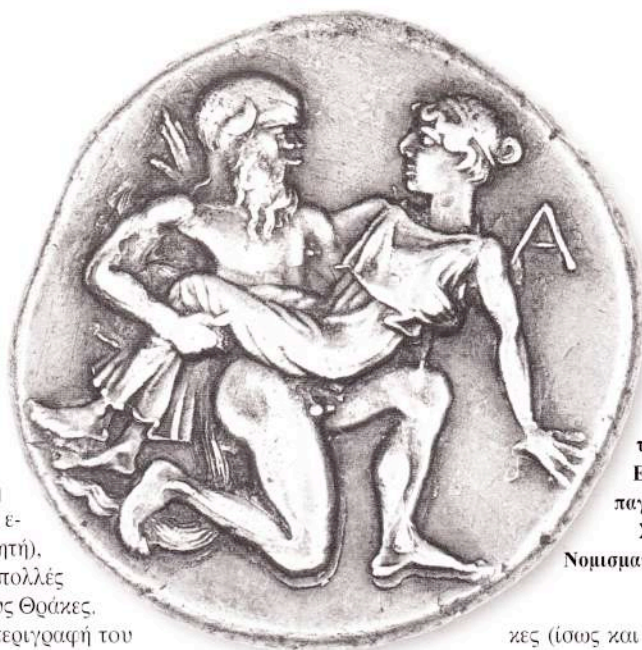
Αργυρός στατήρας Θάσου, περί το 435-411 π.Χ. Εικονίζεται αρ- παγή Νύμφης από Σάτηρο (Αθήνα, Νομισματικό Μουσείο).

Τ ο νησί αποικίσθηκε, σύμφωνα με τη μαρτυρία του ποιητή Αρχιλόγου (απ. 93α, 105, κείμενο 30), από Πάριους κατά τη δεκαετία του 680 π.Χ. (την εποχή του πατέρα του ποιητή), οι οποίοι αντιμετώπισαν πολλές δυσκολίες με τους ντόπιους Θράκες. Αν δώσουμε πίστη στην περιγραφή του Ηροδότου (ΣΤ', 46), το νησί έλαβε το όνομά του από τον Θάσο, έναν από τους Φοίνικες οι οποίοι "αποίκισαν τη νήσο που σήμερα έχει το όνομά της από εκείνον. Τα φοινικικά μεταλλεία βρίσκονταν ανάμεσα στις τοποθεσίες που ονομάζονται Αίνυρα και Κοίνυρα απέναντι από τη Σαμοθράκη. Είναι ένα μεγάλο βουνό που το έχουν αναποδογυρίσει αναζητώντας χρυσό" (για τα αρχαιολογικά ευρήματα, βλ. BCH 88, 1964, 280 κ.ε.). Σύμφωνα με τον Ηρόδοτο, η Θάσος αποικίσθηκε (μάλλον κατά ένα μέρος της) πρώτα από τους Φοίνικες, όταν αυτοί έφθασαν "...σε αναζήτηση της Ευρώπης" (Β', 44), στην πραγματικότητα βέβαια θέλοντας να καρπωθούν τον ορυκτό πλούτο του νησιού. Γρήγορα όμως το νησί ετέθη υπό τον έλεγχο των Ελλήνων. Μέσα από τα ποιήματα του ποιητή, φαίνεται πως δεν έλλειψαν οι πολεμικές αναμετρήσεις των Παρίων με τους Θρά-