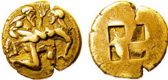
Αργυρός (AR) στατήρας Θάσου, 525-463 π.Χ. Βάρος 8,59 γρ. [SNG Copenhagen 1010] (Maller Galleries/Auction April 15, 2000/72) Εμπροσθότυπος: Αρπαγή Νύμφης από Σίληνό. Η Νύμφη προβάλλει αντίσταση και έχει σπρωμένο το δεξί της χέρι με τα πέντε δάκτυλα ενωμένα να προβάλλουν μετωπικά ανάμεσα στις δύο μορφές. Ο ιθυγαλλικός Σίληνός τρέχει προς τα δεξιά με τον συμβατικό τρόπο της αρχαϊκής εποχής. Πρόκειται για ένα έξοχο παράδειγμα αρχαϊκής τεχνοτροπίας σε έναν δημοφιλή ερωτικό τύπο. Οπισθότυπος: Εγκοίλο τετράγωνο.