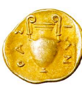
Αργυρό (AR) τριμμοβόλιο Θάσου, 455-416 π.Χ.