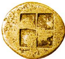
Αργυρή (AR) δραχμή Θάσου, 525-463 π.Χ.

Βάρος 3,48 γρ. (Malter Galleries/Auction April 15, 2000/73)