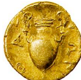
Αργυρό (AR) τριμμοβόλιο Θάσου, 455-416 π.Χ.