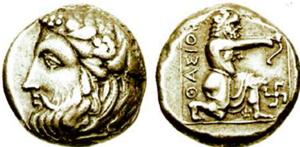
Αργυρή (AR) τετραδραχμο Θάσου, 390-380 π.Χ.

Οπισθότυπος: ΘΑΣΙΟΝ. Ηρακλής τοξότης προς τα δεξιά. Η όλη παράσταση περικλείεται σ' ένα τετράγωνο.