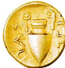
Αργυρό (AR) τριμμοβόλιο Θάσου, 455-416 π.Χ.