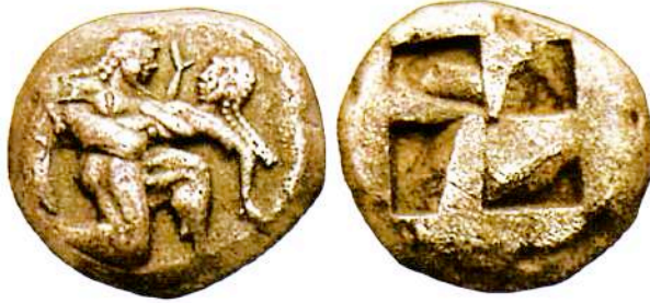
Αργυρός (AR) στατήρας Θάσου, 525-463 π.Χ. Βάρος 9,76 γρ. [SNG Copenhagen 1009/Kraay, ACGC, 519] Εμπροσθότυπος: Αρπαγή Νύμφης από Σίληνό. Η Νύμφη προβάλλει αντίσταση και έχει σπρωμένο το δεξί της χέρι, σε σχήμα ύψιλον "Y", ανάμεσα στις δύο μορφές. Ο Σίληνός τρέχει προς τα δεξιά με τον συμβατικό τρόπο της αρχαϊκής εποχής. Οπισθότυπος: Εγκοίλο τετράγωνο.