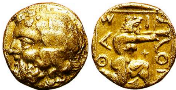
Αργυρή (AR) δραχμή Θάσου, 411-350 π.Χ.

Οι αρχαίοι στατήρες της Θάσου φέρουν στον εμπροσθότυπο το ζωηρό σύμπλεγμα της αραπής Νύμφης από Σιληνό, ένα θέμα αγα-