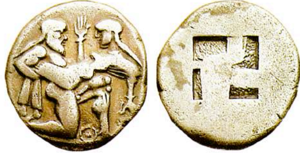
Αργυρός (AR) στατήρας Θάσου, 525-463 π.Χ. Βάρος 8,50 γρ. [SNG Copenhagen 1013/Kraay, ACGC, 520] (Classical Numismatic Group, Inc. /Auction/ID 61135) Εμπροσθότυπος: Αρπαγή Νύμφης από Σίληνό. Η Νύμφη προβάλλει αντίσταση και έχει σπρωμένο το δεξί της χέρι με τα πέντε δάκτυλα ενωμένα να προβάλλουν μετωπικά ανάμεσα στις δύο μορφές. Ο ιθυγαλλικός Σίληνός τρέχει προς τα δεξιά με τον συμβατικό τρόπο της αρχαϊκής εποχής. Θ στο κάτω μέρος. Οπισθότυπος: Εγκοίλο τετράγωνο.