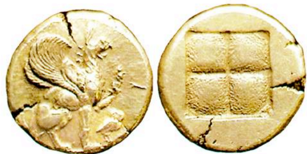
Αργυρός (AR) στατήρας της Τέω, περίπου 478-465 π.Χ.

Οπισθότυπος: Εγκοίλο τετραμερές τετράγωνο.