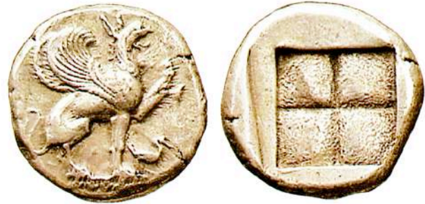
Αργυρός (AR) στατήρας της Τέω, περίπου 478-465 π.Χ.

Οπισθότυπος: Εγκοίλο τετράμερες τετράγωνο.