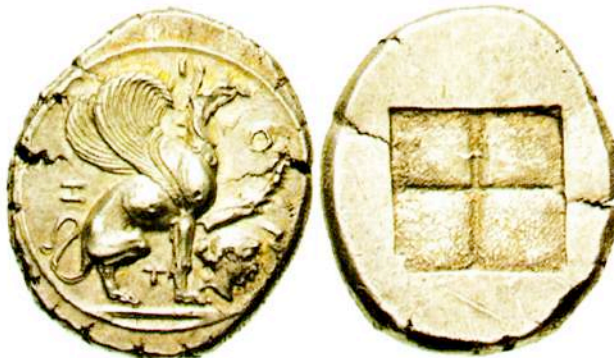
Αργυρός (AR) στατήρας της Τέω, περίπου 470/465-449 π.Χ.

νορίς την Τέω, όπως και άλλες ιωνικές πόλεις, στην αναζήτηση νέων πηγών στην Ανατολή και την Αίγυπτο. Ετσι η Τέως συμμετείχε στην ίδρυση της πόλης Ναύκρατης στην Αίγυπτο όταν ο φιλέλληνας φαραώ Αμασις επέτρεψε σε Ιώνες εμπόρους να εγκατασταθούν στη χώρα του. Η Τέως, η Χίος, η Φώκαια, οι Κλαζομενές, η Ρόδος, η Κνίδος, η Αλικαρνασσός, η Φάσηλις και η Μυτιλήνη, ίδρυσαν μάλιστα από κοινού ένα μεγάλο και ονομαστό ιερό, το Ελληνιον 9 . Απόδειξη εξάλλου αυτής της εμπορικής δραστηριότητας των Τηίων είναι και η ανεύρεση νομισμάτων και δειγμάτων κεραμικής της πόλης τους στη Συροπαλαιστίνη και την Αίγυπτο. Μετά ήλθε η περσική κατάκτηση και η φυγή. Εντούτοις, αρκετοί κάτοικοι πρέπει να παρέμειναν πίσω καθιστώντας γρήγορα την πόλη τους οικονομικά ανθηρή στα πλαίσια της περσικής αυτοκρατορίας. Κατά την ιωνική επανάσταση έλαβε μέρος στη γαμμαχία της Λάδης (495 π.Χ.), εποχή κατά την οποία υπολογίζεται ότι είχε πληθυσμό 14.000 κατοίκους. Υποθέτουμε όμως ότι πρέπει να είχε πολύ μεγαλύτερο πληθυσμό κατά την ακμή της, στα μέσα δηλαδή του δού αιώνα π.Χ.