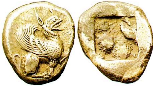
Αργυρή (AR) δραχμή της Τέω, περίπου 540-478 π.Χ.