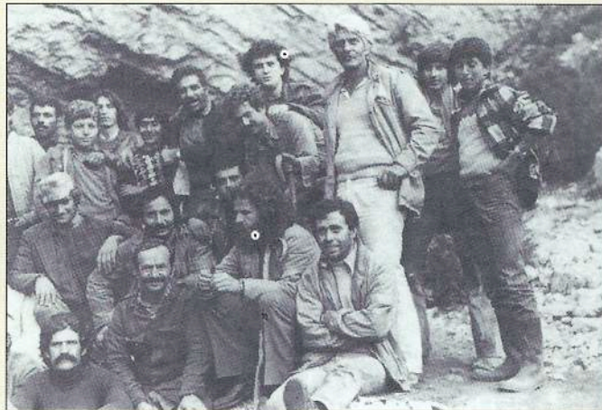
Αναμνηστική φωτογραφία από το Ιδαίο Αντρο.