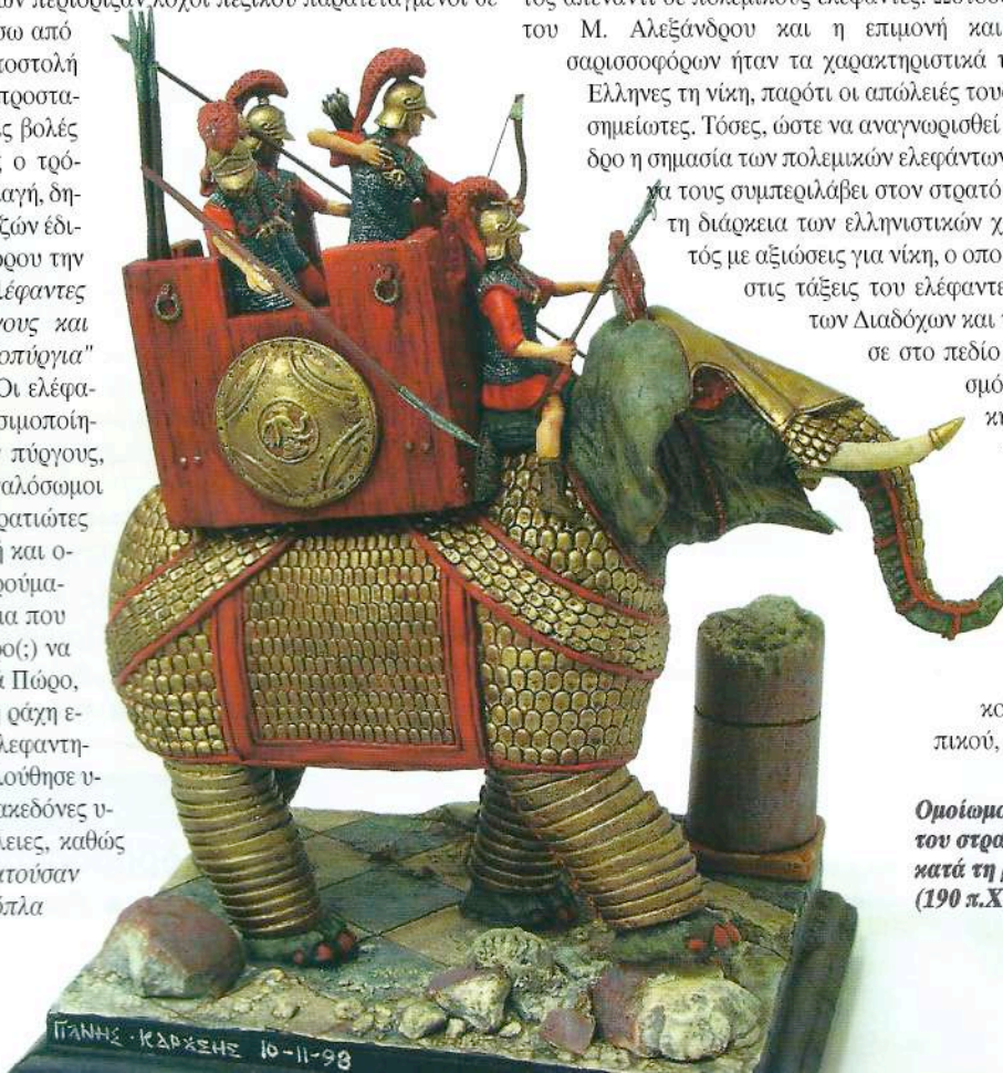
Όμοίωμα πολεμικού ελέφαντα του στρατού των Σελευκιδών κατά τη μάχη της Μαγνησίας (190 π.Χ.). Έργο του Γ. Καρούση.

Αυτή ήταν η πρώτη μάχη την οποία έδωσε με επιτυχία ελληνικός στρατός απέναντι σε πολεμικούς ελέφαντες. Ωστόσο, η στρατηγική ιδιοφυΐα του Μ. Αλεξάνδρου και η επιμονή και η μαχητικότητα των σαρισσοφόρων ήταν τα χαρακτηριστικά τα οποία χάρισαν στους Έλληνες τη νίκη, παρότι οι απώλειές τους ήταν οπωσδήποτε αξιοσημείωτες. Τόσες, ώστε να αναγνωρισθεί αμέσως από τον Αλέξανδρο η σημασία των πολεμικών ελεφάντων στο πεδίο της μάχης και να τους συμπεριλάβει στον στρατό του. Στο εξής και σε όλη τη διάρκεια των ελληνιστικών χρόνων δεν υπήρξε στρατός με αξιώσεις για νίκη, ο οποίος δεν είχε ενσωματώσει στις τάξεις του ελέφαντες. Έτσι, κατά την εποχή των Διαδόχων και των Επιγόνων κυριάρχησε στο πεδίο της μάχης ένας συνδυασμός οπλιτικής (μακεδονικής) φάλαγγας και ελεφάντων. Τα κύρια πλεονεκτήματα των πολεμικών ελεφάντων ήταν το μέγεθος (ιδίως των ινδικών) και η τρομακτική τους όψη. Αποδείχθηκαν ιδιαίτερα αποτελεσματικοί κατά του εχθρικού ιππικού, καθώς τα άλογα, τα