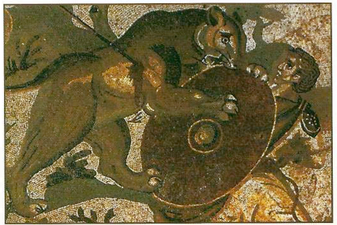
Η ανάγκη προμήθειας άγριων ζώων για τις θηριομαχίες των ρωμαϊκών αρένων, όπου σφαγιάζονταν χιλιάδες ζώα καθημερινά, οδήγησε στην εξαφάνιση πολλών από αυτά στη Βόρειο Αφρική. Ψηφιδωτό από κυνήγι άγριου θηρίου. Villa Armerina, Σικελία.

Ισπανία, όπου ζει η οικογένειά του, η γυναίκα με τον γιο του. Η δραματική παρέμβαση της ταινίας εξελίσσεται με τον Κόμμοδο να σκοτώνει τον Μ. Αυρήλιο (έτσι «λύνεται» και ο ιστορικά αινιγματικός του θάνατος), να καθαρίζει τον ισχυρό στρατηγό, του οποίου διατάζει την εκτέλεση, και να σφάζει την οικογένειά του στην Ισπανία. Ο Μάξιμος δραπετεύει αλλά τελικά καταλήγει σκλάβος και εν συνεχεία μονομάχος στη σχολή ενός παλαιάχου απελευθέρου μονομάχου, του Πρόξιμου. Η συνέχεια βέβαια είναι αναμενόμενη: ο Μάξιμος αναδεικνύεται σε έναν ανίκητο μονομάχο, που η φήμη του τον οδηγεί στη Ρώμη και στο Κολοσσαίο, στη μεγαλύτερη αρένα του κόσμου. Η μοναδική επιθυμία του Μάξιμου, αυτή που του δίνει δύναμη να κρατηθεί ζωντανός, είναι να εκδικηθεί για τον θάνατο των δικών του και να σκοτώσει τον ποταπό αυτοκράτορα Κόμμοδο. Κατόπιν μπορεί να πεθάνει για να τους συναντήσει στον άλλο κόσμο, όπως ζει την εμπειρία αυτήν μέσα από τα έντονης συναισθηματικής δύναμης όνειρά του. Δύναμη δεν του δίνει, όπως θα περιμέναμε κανείς, η ανερχόμενη τότε χριστιανική πίστη, η οποία απουσιάζει ως κοσμοϊστορικό γεγονός από την ταινία, αλλά η παγανιστική του θρησκεία (είναι τρυφερή η στιγμή που χαϊδεύει τα δύο πλύνια ειδώλια-ομοιώματα της γυναίκας και του γιου του) και η επιθυμία του για εκδίκηση («θα σε εκδικηθώ σ' αυτήν τη ζωή ή στην επόμενη», λέει στον Κόμμοδο).