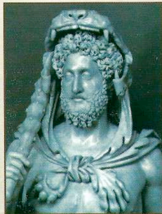
Ο μονομάχος-αυτοκράτορας Κόμμοδος παριστάνεται ως Ηρακλής με λεοντή και ρόπαλο (Maria Theresse Natale).

μάς ξεναγούν με έναν εντυπωσιακό πραγματικά τρόπο στην Αιώνια Πόλη: σαν χρήστες ενός ψηφιακού παιχνιδιού (CD-ROM) «πετάμε» και απολαμβάνουμε από ψηλά το Κολοσσαίο και στη συνέχεια, όπως ένας αρχαίος Ρωμαίος, βαδίζουμε στην Απλία Οδό και μέτουμε στη θριαμβευτική είσοδο του Κόμμοδου στη Ρώμη. Μια σειρά από ανατριχιαστικές και συγκλονιστικές μονομαχίες στην αρένα του Κολοσσαίου ζωντανεύουν ικανοποιητικά και με κινισμό την αγριότητα του ρωμαϊκού «άγτος και θεάματα» (το οποίο άλλωστε φαίνεται να «συνοδεύει» και τον δικό μας σύγχρονο πολιτισμό του 20ού-21ου αιώνα μ.Χ.!!). Το ρωμαϊκό «imperium» παρουσιάζεται σε όλο του το μεγαλείο. Ατυχώς, ο ρωμαϊκός λαός εμφανίζεται μόνο με τη μια του όψη, ως όχλος που απολαμβάνει αιματηρά παιχνίδια. Και βέβαια δεν ήταν μόνο έτσι οι Ρωμαίοι (όπως εξάλ-